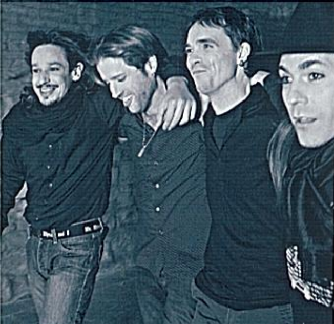
► "LA MADUREZ SE HA NOTADO A LA HORA DE SIMPLIFICAR".

"Están los siempre, no hay nadie que haya roto últimamente: rompió Marea a principios de los 2000 y no ha vuelto a pasar nada nuevo en diez años. Están los mismos: Barricada, Extremoduro cuando saque disco y Marea cuando haga lo mismo. Cada diez años suele aparecer alguien que rompe: primero fue Leño, luego Barricada y luego Extremoduro. Estamos hablando de Rock urbano. El panorama lo vemos aburrido. Los músicos se deberían comer más la cabeza musicalmente". ■